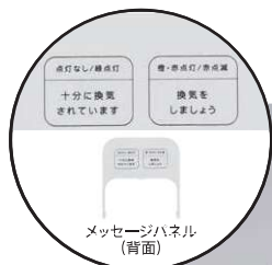
メッセージパネル (背面)

材質 : ABS 外形寸法 : 約100(W)×37(D)×103(H)mm 質量 : 約180g 電源 : USB給電 動作環境 : 温度:5~35℃、湿度:30~80% ※非結露 保存環境 : 温度:-10~55℃、湿度:5~80% ※非結露 CO2検出範囲 : 400~5000ppm CO2表示誤差 : ±(5%+40ppm) CO2検出分解能 : 1ppm 検知方式 : 光音響方式(光学式) 補正機能 : 自動/手動キャリブレーション JAN : 4971660778850