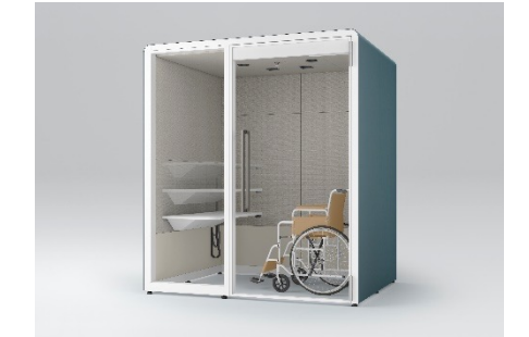
背面壁パネルタイプ