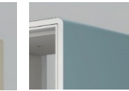
A7:サテンフォグブルー