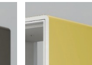
U5:サテンストロング イエロー