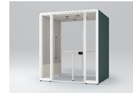
背面壁ガラスタイプ

窓際やオフィスの中にレイアウトする際はガラスタイプをお選びいただきますと視線が通ります。壁際や視線を遮りたい時はパネルタイプがおすすめです。