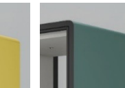
G5:サテングレイ ッシュオーブ