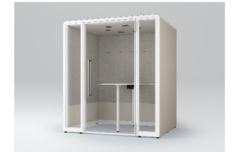
背面壁パネルタイプ