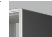
W3:サテンダーク グレーW