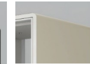
F6:サテングレイッシュ ブラウン