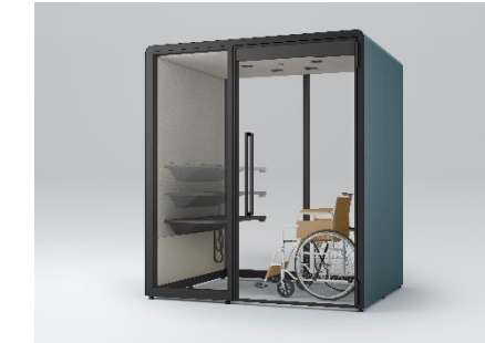
背面壁ガラスタイプ

窓際やオフィスの中にレイアウトする際はガラスタイプをお選びいただけます。壁際や視線を遮りたい時はパネルタイプがおすすめです。