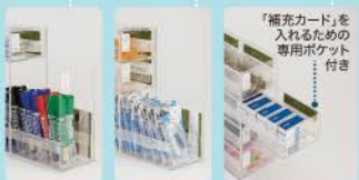
引き出し(大) 引き出し(中) 引き出し(小)